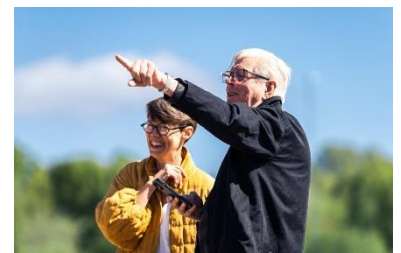
Elna Svenle, Museichef på Vandalorum och trädgårdsarkitekten Piet Oudolf.

Oudolfs monumentala trädgård på Vandalorum är hans första vid en nordisk kulturinstitution. Konstträdgården omfattar bl a en 3 500 m 2 stor perennäng och ca 26 000 plantor av drygt 100 olika växtslag. Tanken är att trädgården ska vara bestående men ständigt i förändring under de växlande årstiderna.