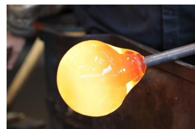
Vi besöker Kosta glasbruk.