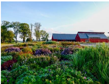
Piet Oudolfs konstträdgård på Vandalorum.

På E4:an reser vi söderut mot Småland. Landskapsnamnet Småland, "de små landen" är ett samlingsbegrepp för de små medeltida hövdingadömen Ydre, Kinda, Tveta, Vista, Vedbo, Tjust, Sevede, Aspeland, Handbörd, Möre, Varend, Finnveden och Njudung. Under vår bussfärd stannar vi till i lilla Väderstad, världsberömt för sina jordbruksmaskiner. Här dricker vi förmiddagskaffe på trevliga Väderstad Centralkonditori.